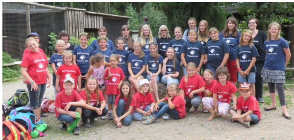
Natur pur – unser Chor in Hellenthal

Am Sonntag, 23. August feierte der Chor im Wildfreigehege in Hellenthal gemeinsam mit den Waschbären, den Rehen, den Alpakas und anderen Tieren das 10-jährige Bestehen. Nach der heiligen Messe in Hambach machten wir uns auf den Weg nach Hellenthal. Dort angekommen, verbrachten wir bei wunderschönem Wetter einen tollen Tag.