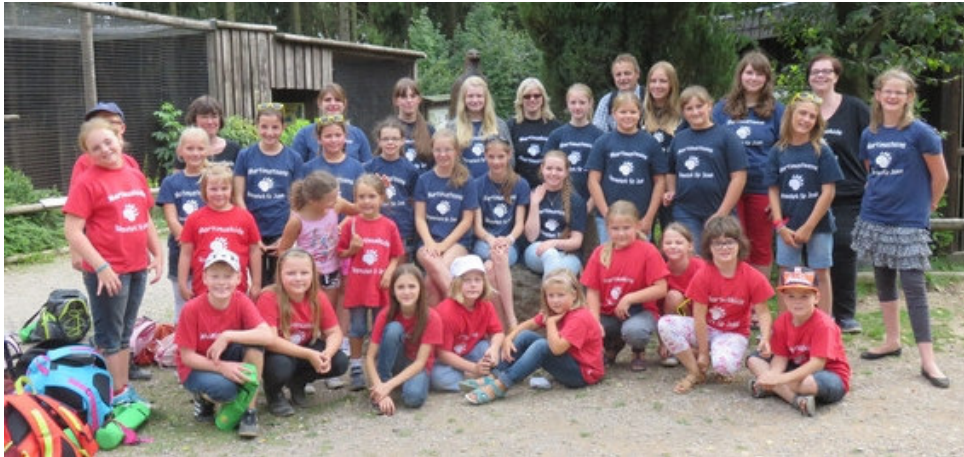
Natur pur – unser Chor in Hellenthal

Am Sonntag, 23. August feierte der Chor im Wildfreigehege in Hellenthal gemeinsam mit den Waschbären, den Rehen, den Alpakas und anderen Tieren das 10-jährige Bestehen. Nach der heiligen Messe in Hambach machten wir uns auf den Weg nach Hellenthal. Dort angekommen, verbrachten wir bei wunderschönem Wetter einen tollen Tag.