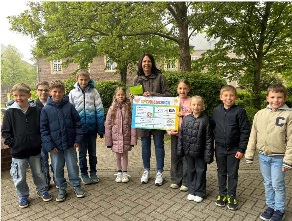
Text und Bild: Katja Bohn-Dolfus

Mit ihrer Spendenaktion haben die Kommunionkinder eindrucksvoll gezeigt, was gelebte Freundschaft und Nächstenliebe bedeuten. Ganz im Sinne ihres Mottos: „Ihr seid meine Freunde“.